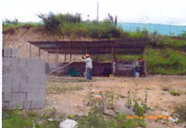
Acondicionamiento de área para disposición de basuras y desechos