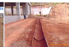
Canal para evacuación de aguas superficiales