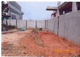
Acondicionamiento de terreno para evacuación de aguas superficiales costado sur